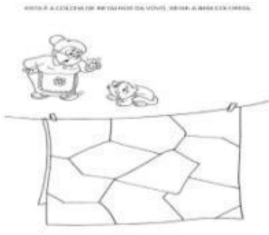
Imagem da atividade.

Vamos colorir a colcha de retalho da vovó pintando de várias cores, pensa que cada pedaço e de uma cor diferente, use a sua imaginação para combinar as cores.